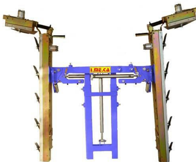
Chassis com 5 movimentos