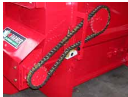
Entraînement mécanique avec 1 démêleur sur DP460 et 560 HGL et HGTL