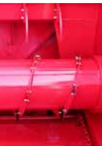
démêleur par hydraulique (DP560GL et GTL)