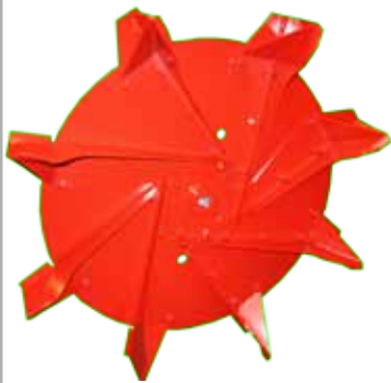
Turbine de ventilation à 8 pales renforcées recouvrant le disque en son centre pour une bonne rigidité de l'ensemble.

turbine à pales crantées spéciale enrubannage brins longs et ensilage d'herbe à l'auto-chargeuse.