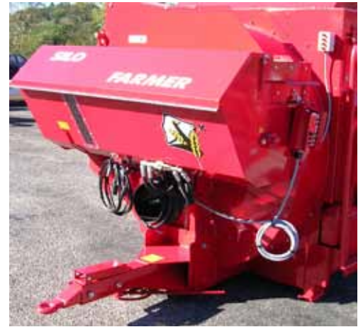
Trémie mélangeuse 500L avec grille de protection, vis à double spires convergentes, hauteur de chargement 1,42 m.