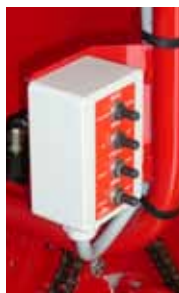
Double commandes électriques 4 fonctions