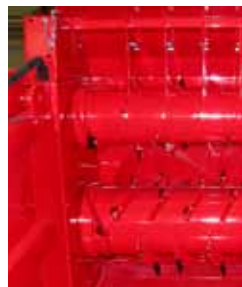
Entraînement mécanique deux gros démêleur rubannage brins foin, ensilage (de série HGL et HGTL)