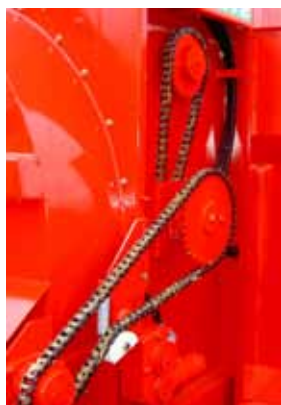
Entraînement mécanique des deux démêleurs sur courtes pailles, série DP560 HGL et HGTL