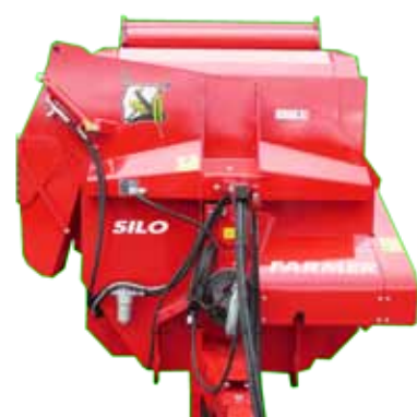
Face-avant goulotte latérale