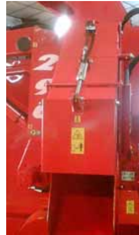
Casquette hydraulique inclinable par commande électrique

Goulotte latérale orientable à 35° AV-AR pour pailler dans les angles