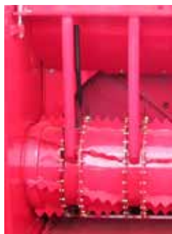
Démêleur enrubans longs avec doigts tabes hydrauliques DP460-560 HGL