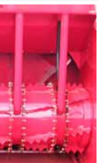
nettoyage brins par brins escamotables (option DP560HGL et HGTL)