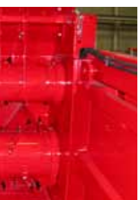
entraînement mécanique des deux démêleurs sur courtes pailles, série DP560 (DP560HGL et HGTL)