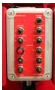
Boîtier électrique toutes fonctions