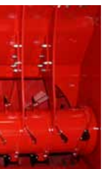
renforts doigts par montage mécanique (DP560HGL et HGTL)