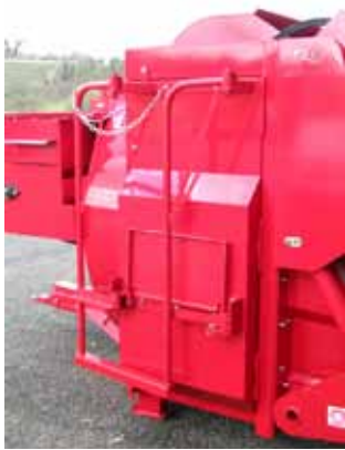
Echelle escamotable pour utilisation avec trémie.

Option: Embrayage du démêleur automatisé à commande électrique