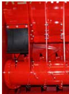
Démêleur tous fixes entraînement (de série DP460)