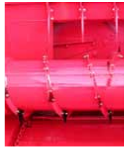
Entraînement du moteur hydro (de série DP 460-)