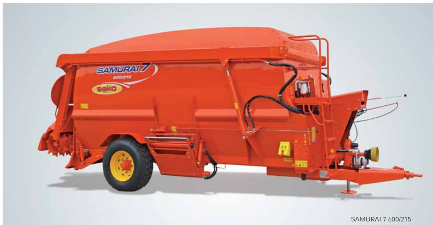
SAMURAI 7 600/215