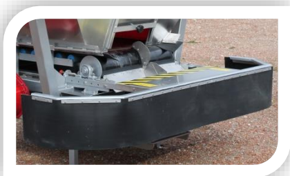
SAIA LIMITADORA DA LARGURA DE TRABALHO

OPCIONAIS COMPATÍVEIS COM OS MODELOS AC (Ver página 11 a 14)