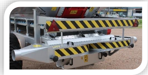
LOCALIZADOR LATERAL PRODUTOS GRANULADOS