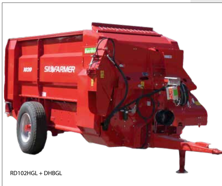
RD102HGL + DHBGL

RD1020 - RD1220 - RD1320 Com saída lateral ou orientável e comando elétrico