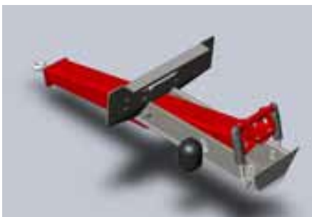
LANÇA HIDRO PNEUMÁTICA

Lança com suspensão regulável e amortecimento por cilindro hidráulico c/ acumulador de azoto