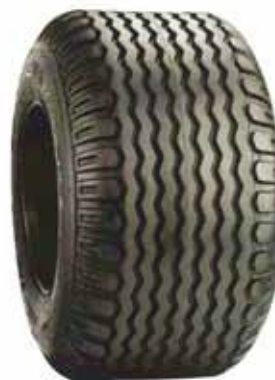
400/60 R 15,3"