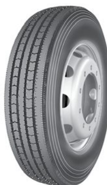
305/70 R 19,5"