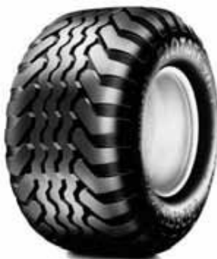
VREDESTEIN Flot TRAC