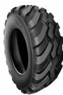
BKT FL 630 ULTRA