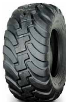
380 HD ALLIANCE