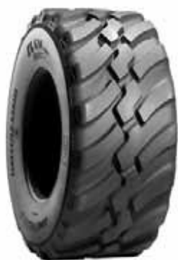
BKT FL 630 PLUS