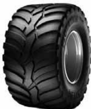
VREDESTEIN Flot PRO