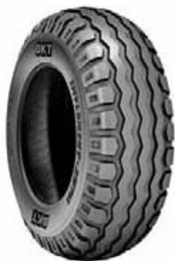
10.0/75 x 15,3"