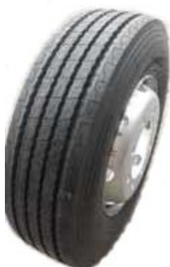
285/70 R 19,5"