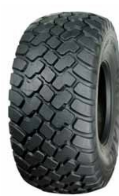
390 HD ALLIANCE