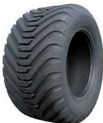
550/60 22,5 / ALLIANCE 328