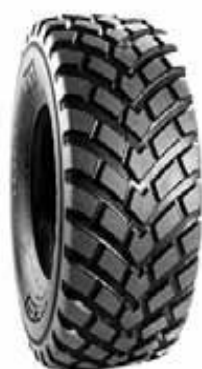
BKT FL 693 PLUS