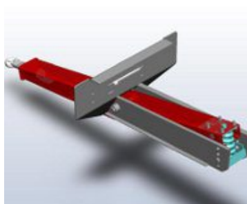
LANÇA COM MOLLA

Lança com suspensão regulável e amortecimento por dupla mola helicoidal