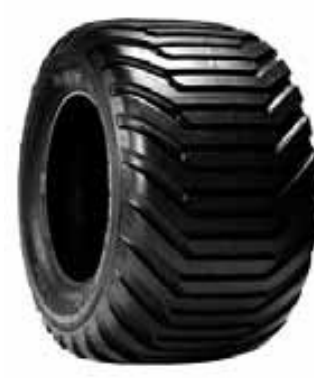
550/60 22,5" / BKT FL 648