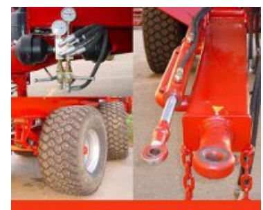
EIXO DIRECCIONAL FORÇADO

Eixo traseiro direccional , forçado através de cilindro hidráulico na lança