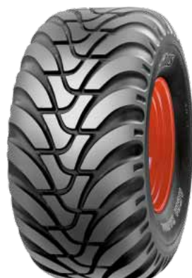
560/60 R 22,5" MITAS