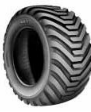
550/60 22,5" / BKT VLINE