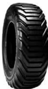
BKT FL 648