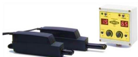
ABERTURA ELÉTRICA DA DOSAGEM