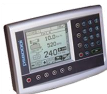
CONTROLE ELETRÓNICO MOD: APOLLO